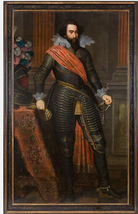
Graaf Hendrick van den Bergh (1573-1638)

Hendrick van den Bergh was de jongste zoon van graaf Willem IV van den Bergh en Maria van Nassau, een broer dus van Anna. In 1612 trouwt hij met Margaretha van Witthem. Hendrick was Spaans veldheer en de derde graaf Van den Bergh in successie die gouverneur van Spaans Gelderland was. Zijn broers Herman en Frederik gingen hem voor. Hendrick was en bekwaam militair en genoot alle vertrouwen van de Spaanse landvoogdes Isabella. In 1629 ging 's-Hertogenbosch mogelijk door toedoen van Hendrick – voor Spanje verloren. Dit deed niet alleen afbreuk aan zijn militaire reputatie maar ook begonnen de Spanjaarden te twijfelen aan zijn trouw aan hen. Vanaf nu werd hij als onbekwaam legeraanvoerder gezien. Men vond hem een verrader, In 1632 vertrok Hendrick naar Den Haag. In maart 1634 werd hij door de Grote Raad van Mechelen schuldig bevonden aan majesteitsschennis, verzet, oproer en verraad. Hij werd bij verstek ter dood veroordeeld. Hendrick overleed in 1638 te Zutphen,