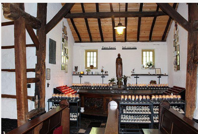
Devotiehoek voor Pater Karel