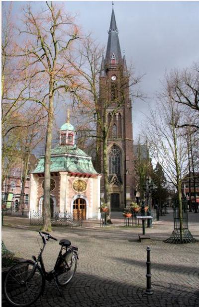
Mariabasiliek te Kevelaer

De verjaardagen van beide dames werden altijd gevierd met familie, vriendinnen en de “notabelen” van het dorp (de burgemeester, de pastoor en de dokter). Ook pater Sangers was vaak van de partij. Op zijn beurt stuurde hij de dames geregeld een kaartje, waarbij hij hen complimenteerde met het prachtige huis waarin zij woonden. Zij bezochten hem ook vaak in Maaseik op.